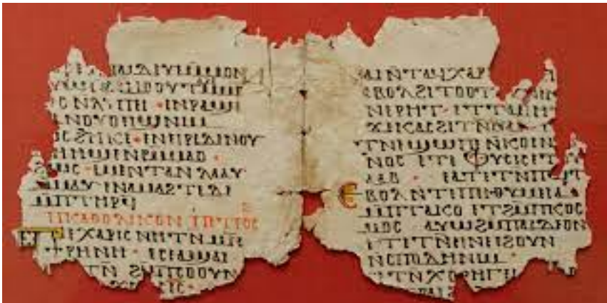
Terugggevonden fragment uit de 2 e brief van Petrus